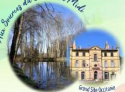
Grand Site Occitanie