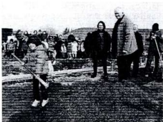
Du premier coup de pelle à .....

Du mobilier a été commandé. Les enfants pensent : « vivement la rentrée pour aller à la nouvelle école ». De nouvelles enseignantes nous rejoindront à la prochaine rentrée. Les enfants du primaire occuperont les anciens locaux de la maternelle : salle peinture, bibliothèque, bureau du psychologue.