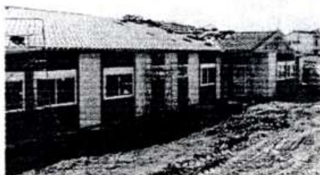
la construction ...