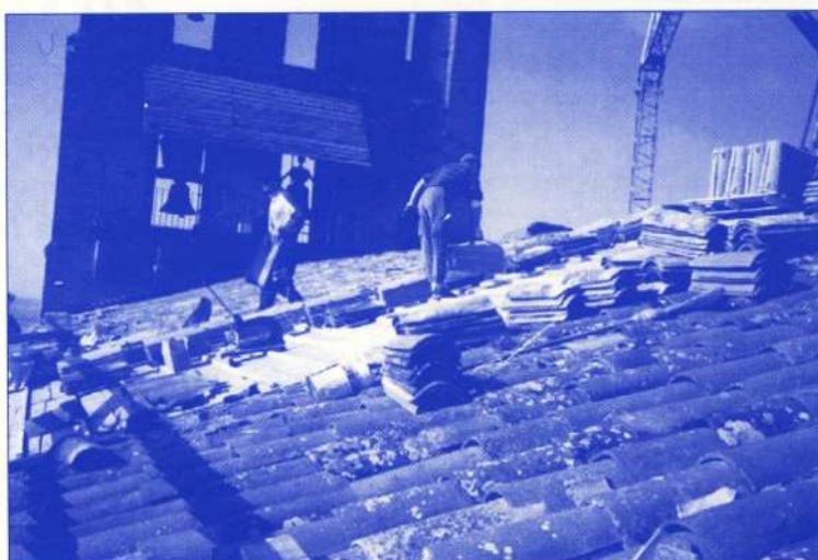
Les ouvriers en plein travail

Après les importants travaux de l'hiver, enfouissement des lignes EDF, mise en place de l'éclairage public... Cet été a fourmillé de petits ou gros travaux d'entretien. D'autres chantiers sont en préparation, en phase administrative ou budgétaire.